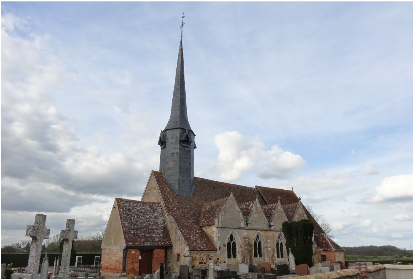
Photographie du monument historique